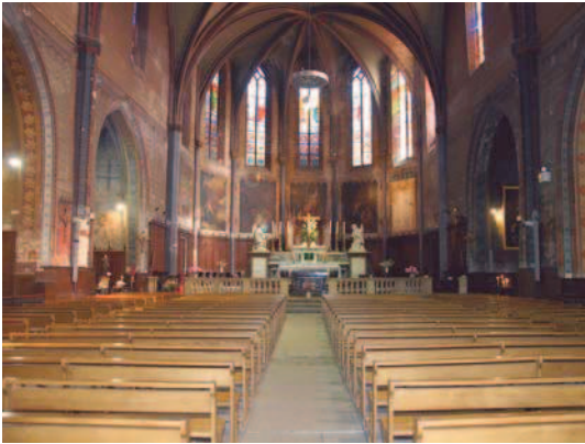
▲ La nef et le chœur de l'église Saint-Jacques